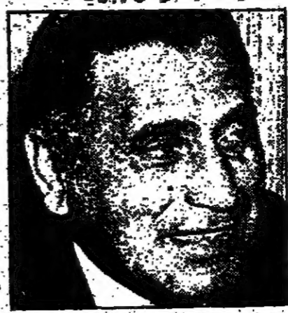
الأمين العام للأمم المتحدة كوفي عنان

تذكر انني سألت «كسورت مايم» - السكرتير العام للأمم المتحدة - ذات مرة ونحن جالسين في قبة مقر المنظمة الدولية: «ما الذي جرى للأمم المتحدة؟»